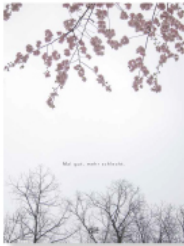
Nora Klein Mal gut, mal schlecht Hatje Cantz Verlag Fotografie 40 Euro